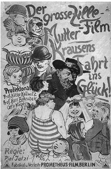
Uraufführungsplakat von Otto Nagel